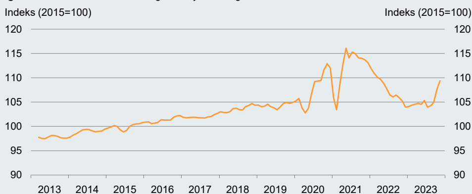
Figur 1 Detailhandelns omsætning var høj i slutningen af 2023

Anm.: Figuren viser detailomsætningen i mængder frem til november 2023. Tremåneders glidende gennemsnit. Sæsonkorrigeret.